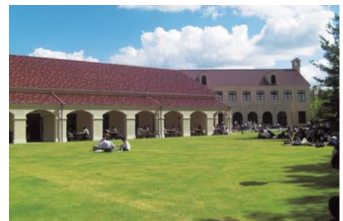
神戸三田キャンパス