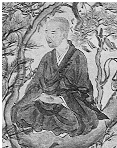
図1 明恵が修行をしている絵

問 3 下線部㉔に関して、次の図1～3は、仏教者の修行の方法について考えるために、授業で先生が示したものである。C、D、先生の三人が、図1～3について交わした次ページの会話中の ・ に入る記述の組合せとして最も適当なものを、後の①～⑥のうちから一つ選べ。