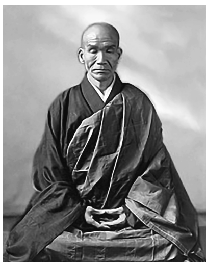
図3 現代の禅僧が修行をしている写真