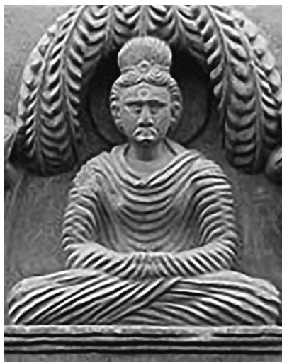
図2 ブッダが修行をしている彫刻